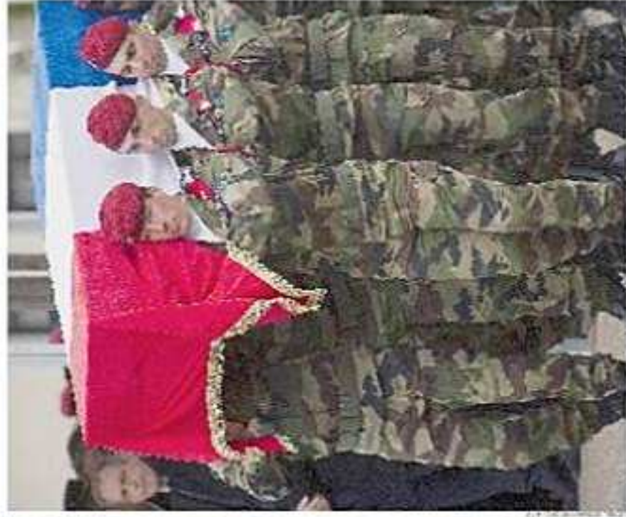
Hier, à Jérusalem, l'inhumation des quatre victimes de confession juive (à gauche) et, dans la caserne du 17 e RGP de Montauban, l'hommage en uniforme aux trois soldats tués.